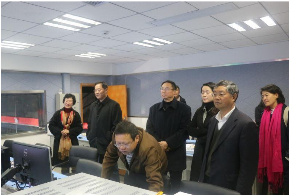
4、原环保部副部长吴晓青，云南省政协主席罗正富、云南省副省长张祖林到示范中心参观交流指导。